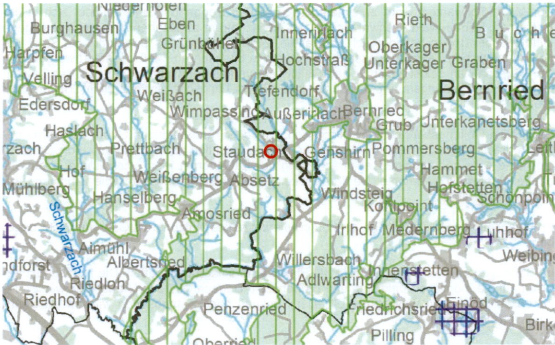
Regionalplan (ohne Maßstab), RISBY 2023