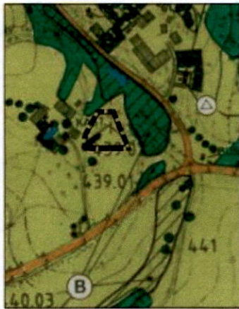
Auszug wirksamer FNP

Mit der Änderung des Flächennutzungsplanes von „Flächen für die Landwirtschaft“ in ein „Sondergebiet für die Nutzung von Solarenergie“ sollen die Voraussetzungen für die Errichtung einer Freiflächen-Photovoltaikanlage im Rahmen einer nachhaltigen städtebaulichen Entwicklung geschaffen werden.