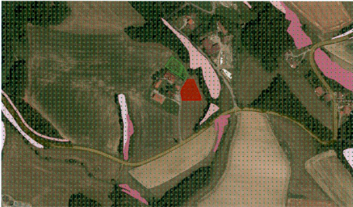
Darstellung der Biotopflächen (rosa); Ökoflächenkataster (Ausgleich/Ersatz) (hellgrün); Landschaftsschutzgebiet (dunkelgrün) und Naturpark (orange); (ohne Maßstab), BayernAtlas 2023

der entstehenden Photovoltaikanlage grenzen außerdem landwirtschaftlich geprägte Flächen an.