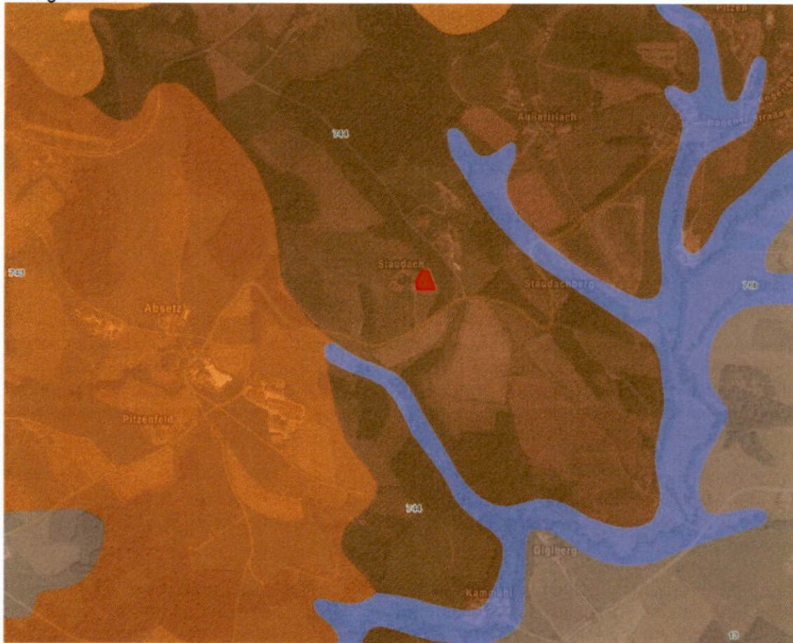
Bodenübersicht (ohne Maßstab), BayernAtlas 2023

Der Untergrund des Planungsgebiets besteht aus „Fast ausschließlich Braunerde aus skelettführendem (Kryo-)Lehm (Lösslehm, Granit oder Gneis)“. Die Fläche wird aktuell als Grünland genutzt.