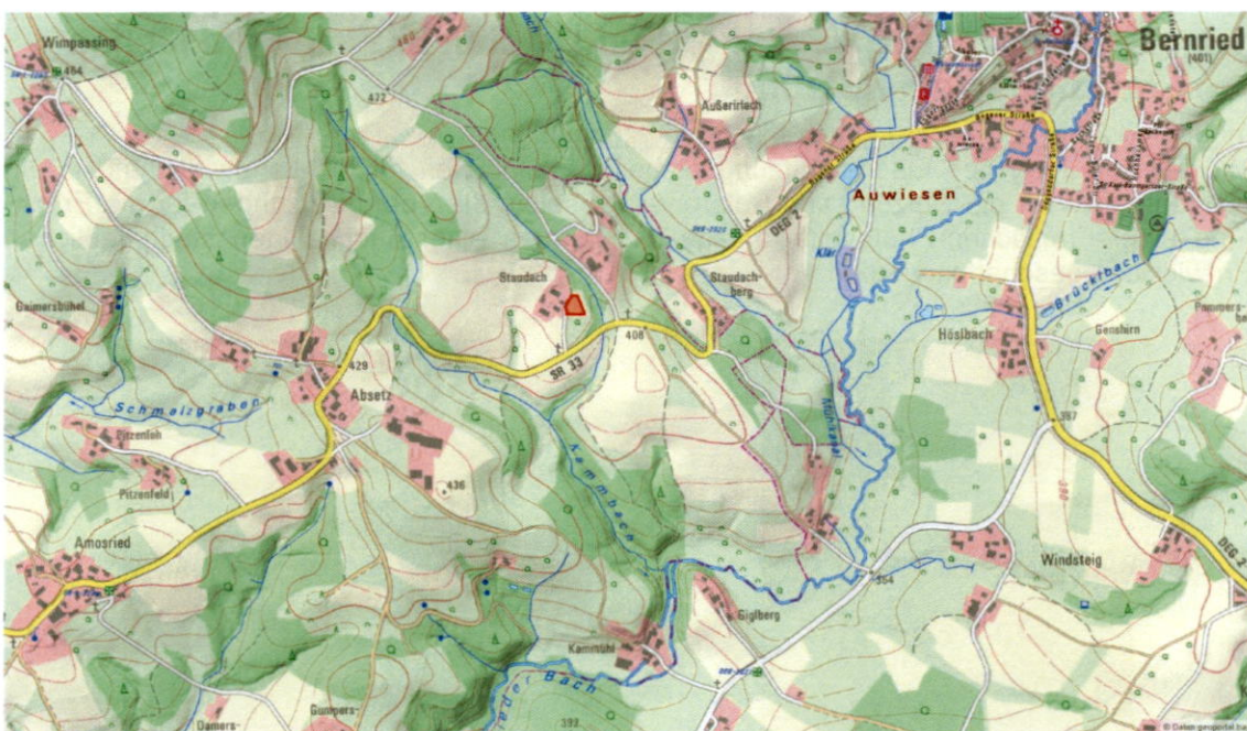
Lageübersicht (ohne Maßstab), BayernAtlas 2023

Der Geltungsbereich umfasst eine Gesamtfläche von 1.211 m 2 .